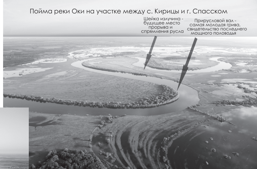
Пойма реки Оки на участке между с. Кирицы и г. Спасском

Шейка излучины – будущее место прорыва и спрямления русла