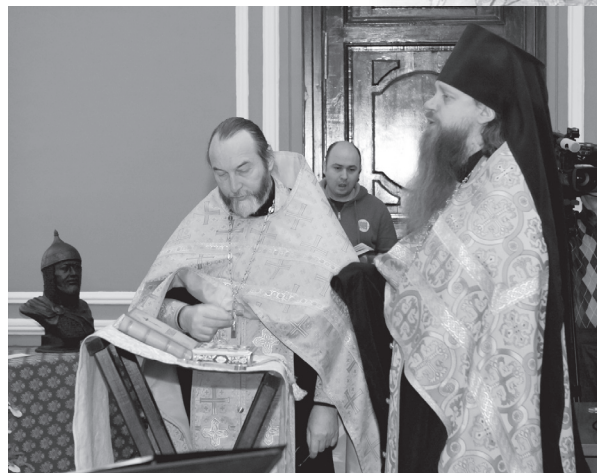
На открытии конференции в РГУ

Олег Рязанский, по словам известного российского историка Д.И. Иловайского, принадлежал «к тем историческим личностям, которые отражают в себе черты известной эпохи или известного народа, закрывая своей тенью и предшественников, и преемников».