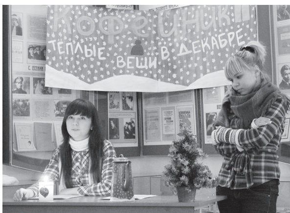
На вечере литературного объединения «Призвание», посвящённом Дню университета

В обескровленной осени с привкусом острой боли жизнь лежит без движения, выглядит очень странно, и истлевшие листья, упавшие с неба, то ли одеяло лоскутное ей, то ли пёстрый саван.