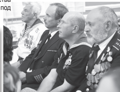
В конференц-зале РГУ