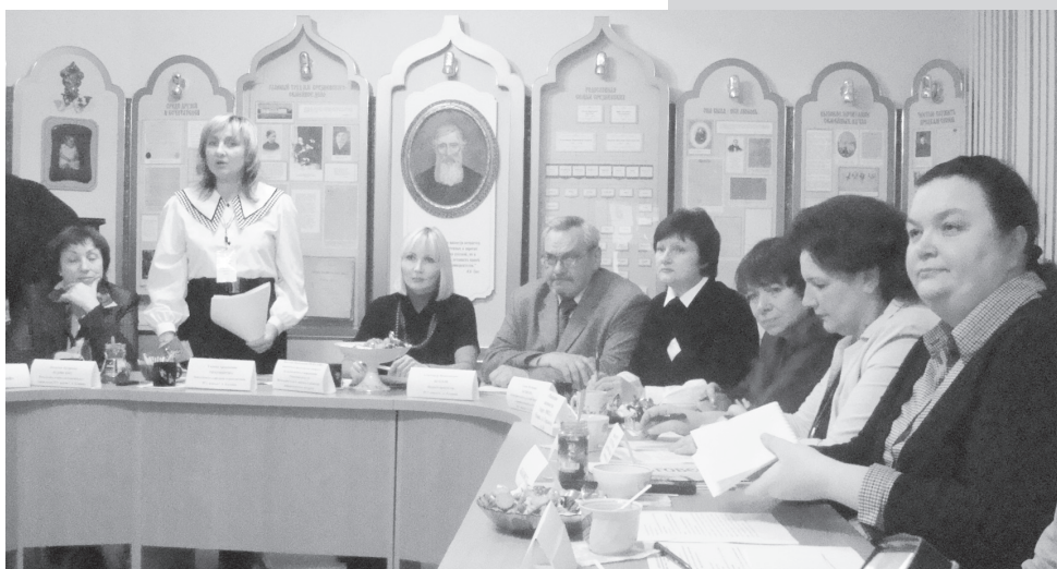
Круглый стол на отделении журналистики. 25 ноября 2009 года