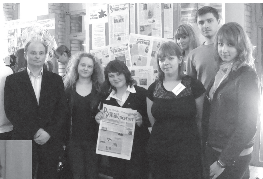
Студенты отделения журналистики представляют газету «Рязанский университет» на открытом молодёжном медиа-форуме «Молодёжь-ИНФО». Апрель 2010 года

групповые тренинги с некоторыми преподавателями. Было даже намерение попытаться отказаться от услуг одного преподавателя, оформив это в виде прошения, «челобитной» от студентов начальству. Теперь об этом вспоминается не иначе как с иронией по отношению к нам тогдашним.