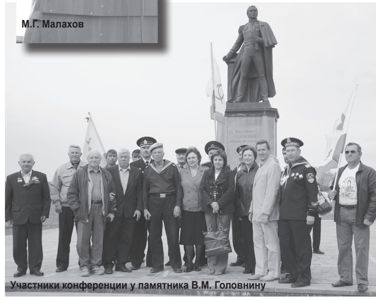
Участники конференции у памятника В.М. Головнину

дворянского рода Головниных, в течение семи лет служил в канцелярии Рязанского дворянского собрания. Дружба с Баженовым сблизила его с масонами.