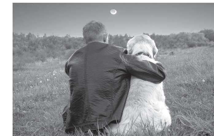
Фоторабота Маргариты Демеевой

Чего держаться? Что хранить? Всё грязно, тошно, равнодушно... Ах, как дрожит худая нить, И только ей всё это нужно.