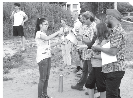
Студенты истфака РГУ имени С.А. Есенина на археологической практике в Старой Рязани